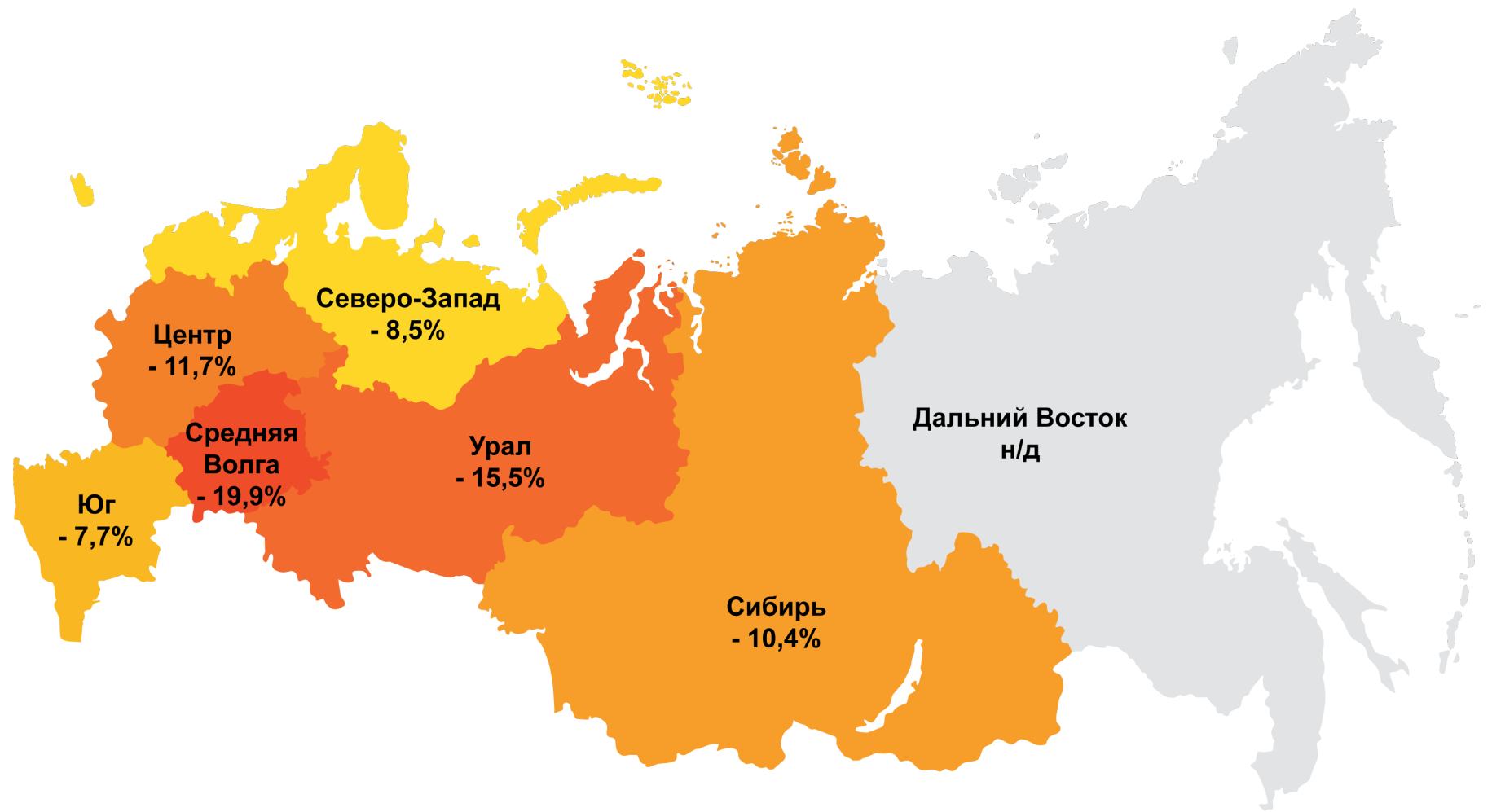
Индекс ИПЕМ-производство по регионам России за 8 месяцев 2009 г. к соответствующему периоду прошлого года