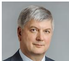
Александр Гусев Губернатор Воронежской области

“ – Что касается воронежского завода (ООО «Сименс Трансформаторы». – Прим. ред.): заказов хватает (как минимум до осени), порядка 80% отгрузки идет на внутренний, российский рынок. Также прорабатывается новая схема управления предприятием, при которой оно продолжит свою стабильную работу на воронежской земле. ”