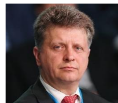
Максим Соколов Вице-губернатор Санкт-Петербурга

“ – Не секрет, что вагонам, которые сегодня еще ходят в нашей подземке, уже не один десяток лет. В ближайшие 10 лет при поддержке федерального бюджета будет произведена масштабная замена этих вагонов. Почти 1 тыс. вагонов заменят в этот 10-летний период на новый современный подвижной состав. ”