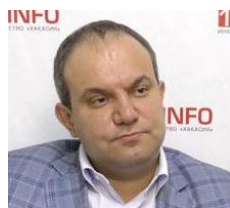
Константин Данилов Президент АО «РМ Рейл Холдинг»

– Возможное сотрудничество (в сфере поставок контейнерных платформ. – Прим. ред.) считаем целесообразным начать с Венгрии, где нам понятны колея, стандарты качества, а также благоприятная внутриполитическая обстановка. <...> Первоначально это может быть проект по сборке вагонов. В частности, фитинговых платформ.