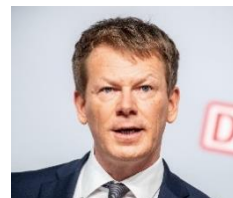
Ричард Лутц Генеральный директор Deutsche Bahn