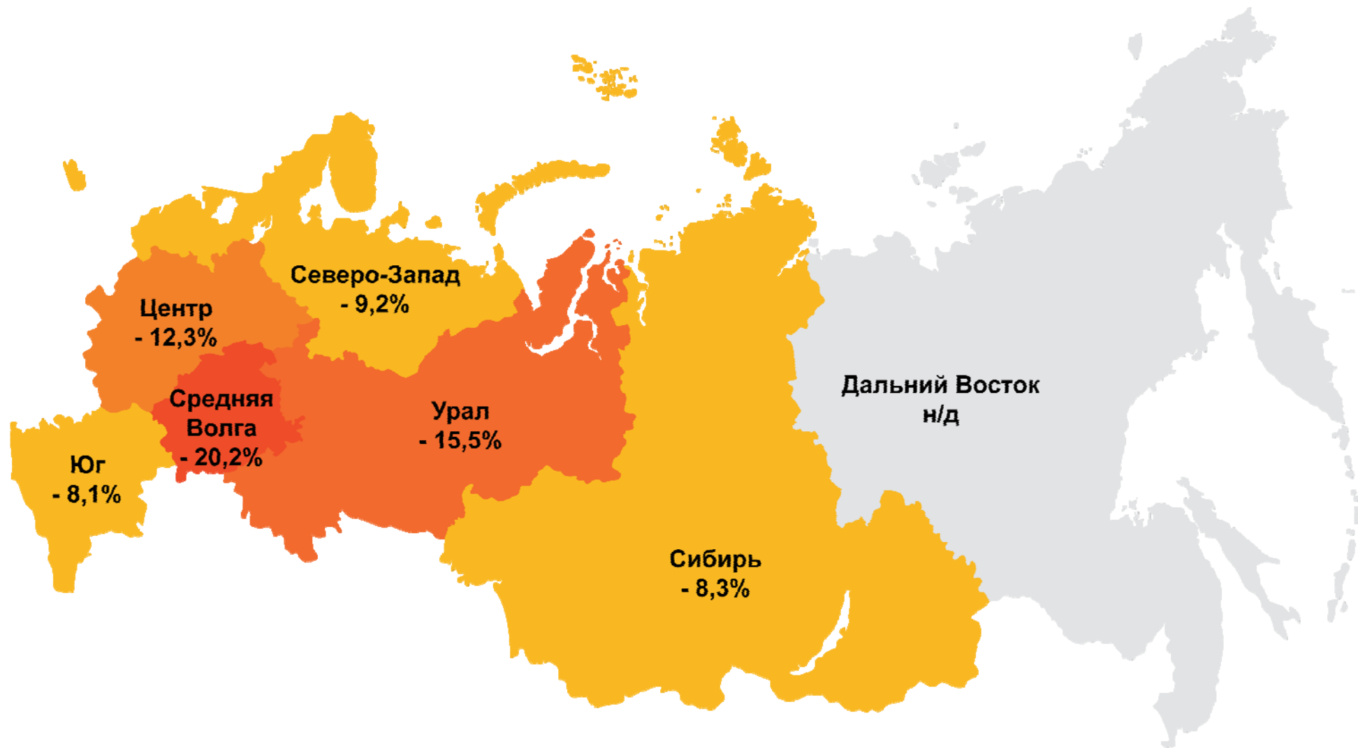
Индекс ИПЕМ-производство по регионам России за 9 месяцев 2009 г. к соответствующему периоду прошлого года